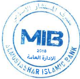
علي طالب غني البناء المدير المفوض